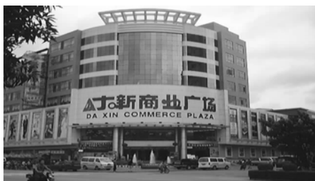
(本年6月オープン的大型スーパーマーケット)

この事で、従来の小売店型(軒先店舗)の 数も減ってきて、ある面ではさびしい感じが します。しかし、全体的にはより便利になり 生活しやすくなる事は大歓迎ですが、この事 で物価が上がる心配もあります。