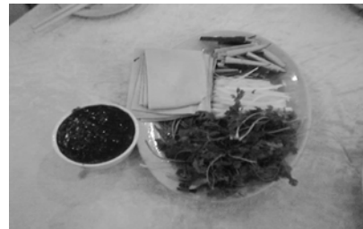
(京醬肉絲 左が特製タレ)

中国名:京醬肉絲(チンチャンロース) チンジャオロースとは違います。 元々は中国東北地方の料理で、北京 ダックの精進料理版とでも言ったほ うがわかりやすいとおもいます。 まず北京ダックの代わりにキュウリと 中国パセリ、(ネギは同じ)これを しみ豆腐の皮(寒豆腐)で巻き特製 味噌タレ(煮込んだ味噌の中に肉が 入っている)をつけて食べます。 一説によると、貧しい人の食べ物だったか? しかし、中国ではなかなか生野菜を 食べる機会が少ないのでこれは かなり健康的な食べ物です!? これは、東北料理店で食べる事が出来 ます。