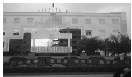
(漁梁園管理区政府建物)