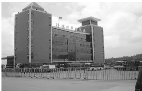
(1日数万人が利用するバスターミナル)